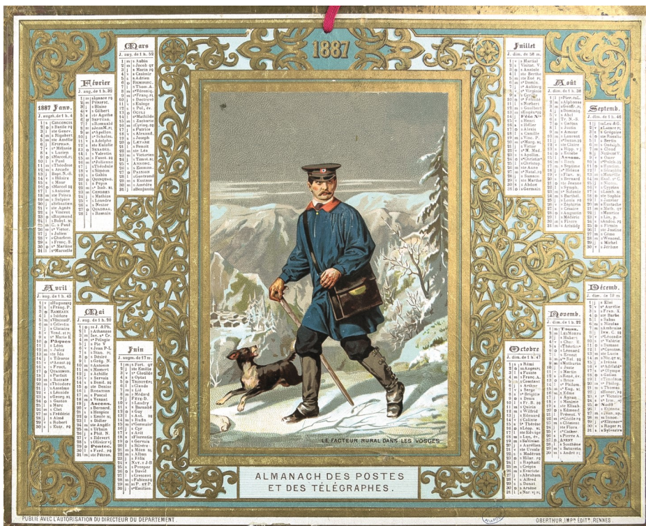
Almanach des Postes et Télégraphes 1887 - Oberthur éditeur - Chromolithographie - Inv. 2009.190.6

Au début, les facteurs ruraux sont mal rémunérés. Ils sont rétribués aux kilomètres parcourus (4 centimes/km en 1830). Ce système est très pénalisant pour les vieux facteurs qui demandent au soir de leur carrière, l'attribution de tournées moins longues. On convient alors en 1851 d'allouer une « haute paye » aux facteurs les plus anciens. Cette « haute paye » doit leur permettre de se faire remplacer et de profiter de quelques jours de repos à une époque où le service s'effectue tous les jours. Ce n'est qu'à partir de la loi du 28 avril 1893 que les facteurs disposent d'un jour de congé par mois au frais du Trésor.