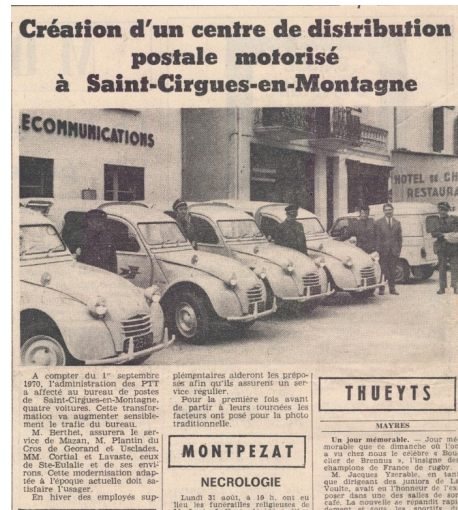
Article du Dauphiné Libéré 2/09/1970.