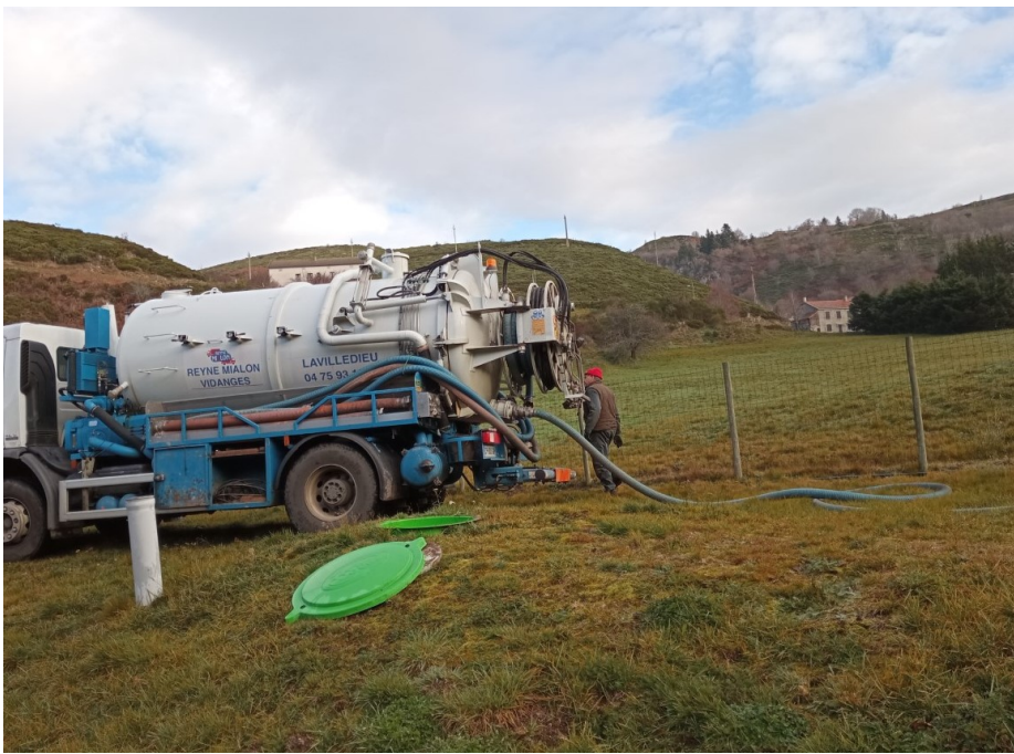
Curage de la station d'épuration. Un nettoyage de la cuve de la station d'épuration est nécessaire par camion pompe une à deux fois par an.