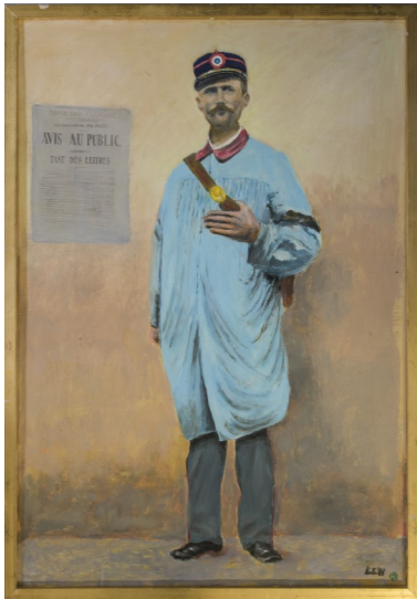
©Musée de La Poste - Léon Bouché, facteur rural - Huile sur toile de Henri Lew - 1898 - Inv. 16554 bis Don Lew

4 000 habitants) sont desservies par un facteur. Partout ailleurs, il faut se rendre dans un bureau de poste pour envoyer ou retirer ses lettres. Louis LENAIN dans son ouvrage « la Poste en Drôme et Ardèche des origines à 1920 », mentionne que l'établissement de poste le plus proche sera Montpezat jusqu'en 1849. Les Mairies rémunèrent un piéton pour la distribution des correspondances administratives. En