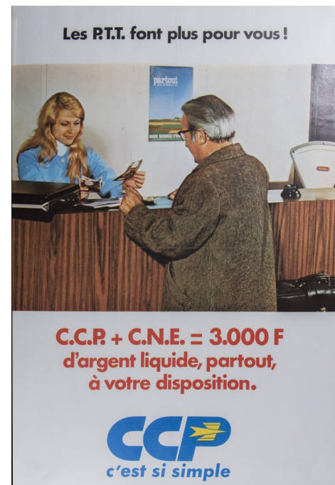
« les P.T.T. font plus pour vous ! » - Campagne « CCP c'est si simple » - Ministère des PTT 1972 - Offset - Inv. 12913

En 2003, l'agence postale devient agence postale communale grâce à une convention par laquelle la commune prend à sa charge le salaire de l'agent, les frais de fonctionnement, contre une participation conséquente de la Poste. Beaucoup d'opérations