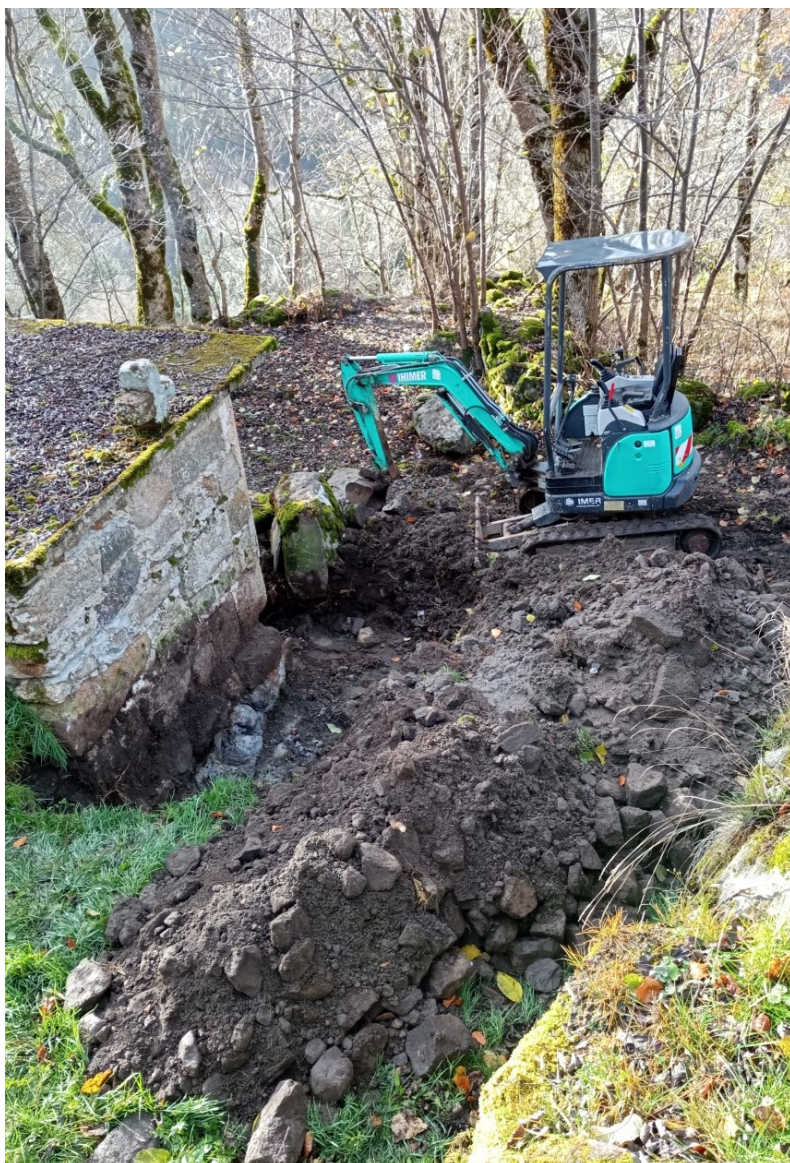
Recherche de la fuite d'eau au lavoir de La Rochette.