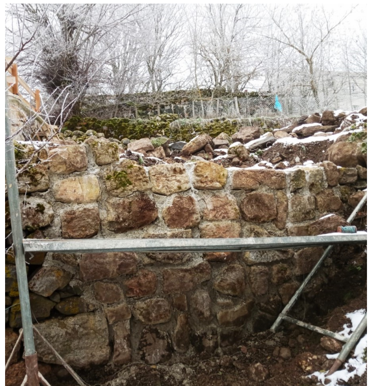
Reprise du mur de soutènement du chemin communal à La Rochette.